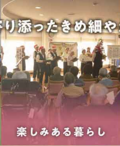
楽しみある暮らし