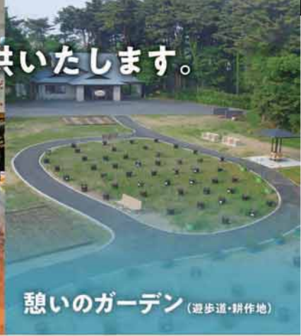
憩いのガーデン (遊歩道・耕作地)