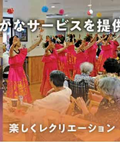
楽しくレクリエーション